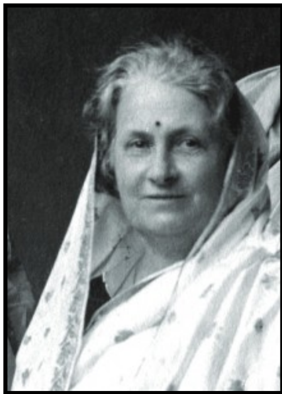
Imagen 4 María Montessori, s. f.