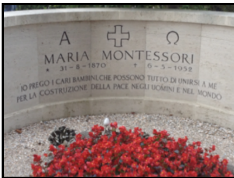
Imagen 5 Tumba de María Montessori (1870-1952)